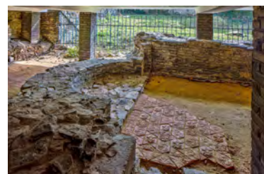
BAZILIKA SV. VAVŘINCE

NAVŠTIVTE TAKÉ BAZILIKU SV. VAVŘINCE A ROTUNDU SV. MARTINA